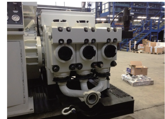
トリプレックスポンプ